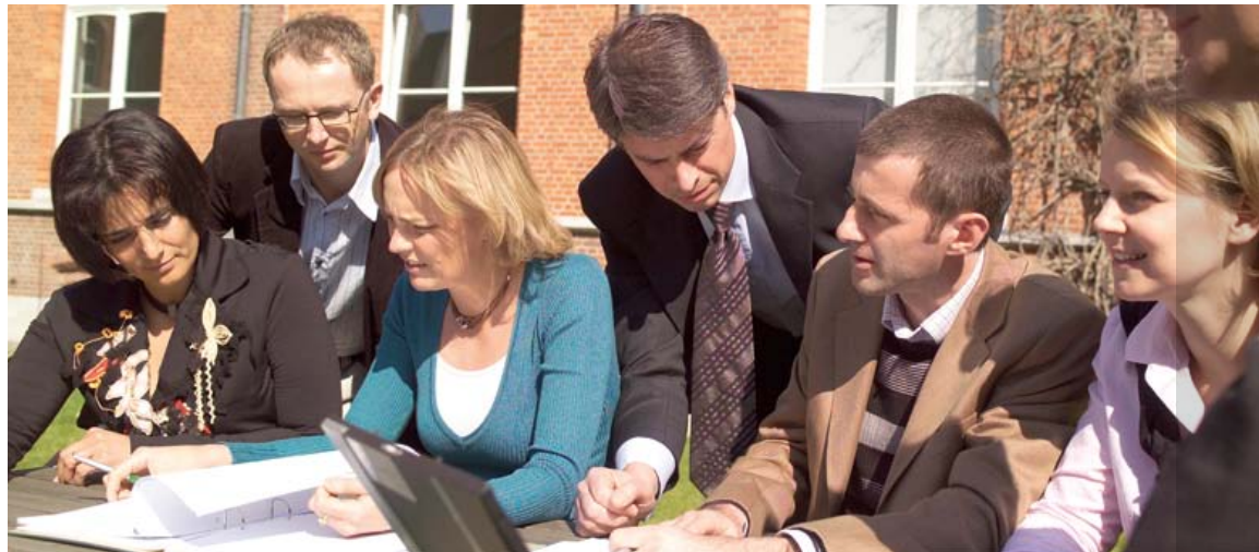
De deelnemers leren door de koppen bij elkaar te steken.