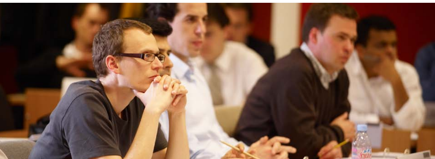
End-to-end inzicht krijgen, dát is het geheim van succesvolle BPM.

U zult versteld staan van onze neus voor de praktijk. We combineren theoretische concepten en praktische cases over het analyseren en verbeteren van bedrijfsprocessen. Zodat u de technieken aan de dagelijkse werkelijkheid kunt toetsen. Onze docenten bereiden de opleidingen grondig voor en vragen u actief deel te nemen aan de case study's en discussies. Want u leert niet alleen van ons, maar ook van de andere deelnemers met wie u ervaringen uitwisselt.