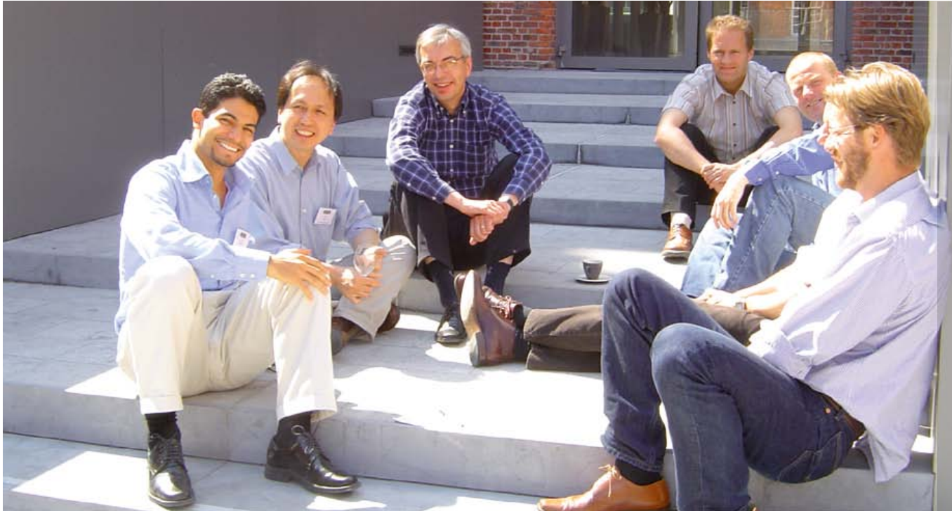
Ervaringen delen tijdens de pauzes.